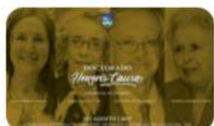
Doctorado "Honoris Causa 2017" otorgado a la Dra. Marta Lamas por la Universidad Autónoma Benito Juárez de Oaxaca