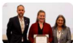
Premio EMULIES 2017 otorgado a la Dra. Ana Buquet por el Consejo Superior del Espacio de Mujeres Líderes de Instituciones de Educación Superior de las Américas y a la Organización Universitaria Interamericana